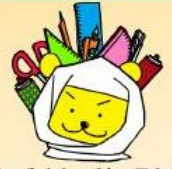
学びの丘イメージキャラクター まなぶ