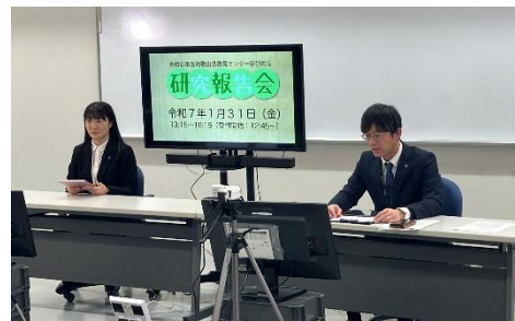
研究報告会（オンライン開催）の様子

研修員は、「教員としての資質の向上に関する指標」に基づくキャリア段階におけるミドルリーダーとして、本県教育の充実・発展に貢献できるよう、研究テーマを設定し、1年間研究と修養に励みます。自身及び所属校の課題解決に向けた研究を行い、「教育センター学びの丘研究報告会」での報告や学びの丘Webページ「研修員研究集録」での公開等を通して、その成果の普及を目指します。