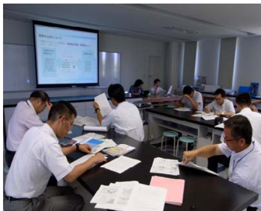
写真 2 講義及びワークショップ