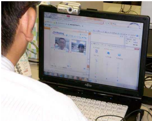
写真 1 TV 会議による意見交換

今回は、問題解決の過程から誤りやつまずきを予想するとともに問題の構成要素のうちいくつかを変更し教材を作成した。図 2 は、平成 20 年度全国学力・学習状況調査算数 B ①を参考に「具体内容」と「課題構成」、「解答形式」を変更して教材を作成したものである。具体内容の「戸だなの幅」を「本の厚さ」に変更し、課題構成をスモールステップに区切り、情報を整理しながら解決方法を身につけられるようにした。また、容易に誤答分析ができるように解答形式を選択式とした。